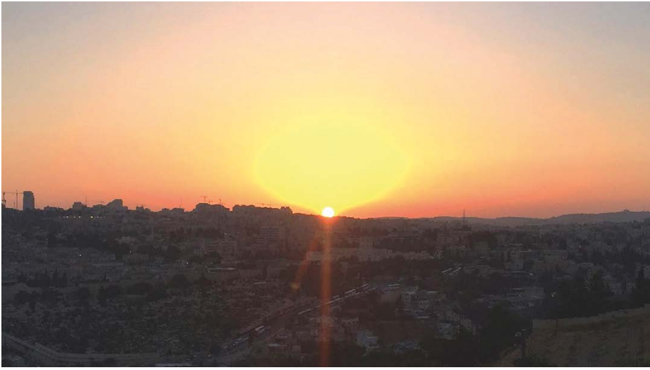
Auringonlasku Öljymäellä. Kuva Nelli Maikoe.