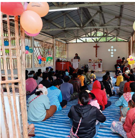
Huai Miin kirkko on koristeltu joulujuhlia varten.

Syrjätien Youtube-kanava Käy tutustumassa Syrjätien elämään Japanissa heidän Youtube-kanavallaan Syrjätieillä Japanissa .