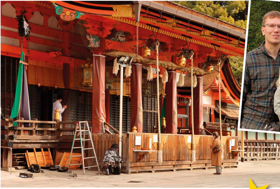
Shintolaispyhäkössä valmistaudutaan japanilaiseen uuteenvuoteen.